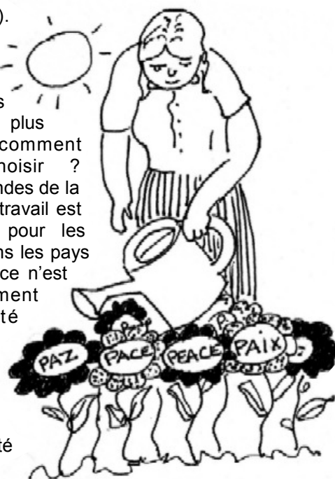
LA CULTURE DE LA PAIX

C'est à chaque femme de décider ce qu'elle veut faire, mais, sans égalité, et encore plus sans équité, comment peuvent-elles choisir ? Comblent les demandes de la vie familiale et du travail est souvent frustrant pour les femmes même dans les pays développés, mais ce n'est pas un argument contre l'égalité d'accès aux emplois. C'est plutôt un argument pour la nécessité de promouvoir l'équité à l'aide de